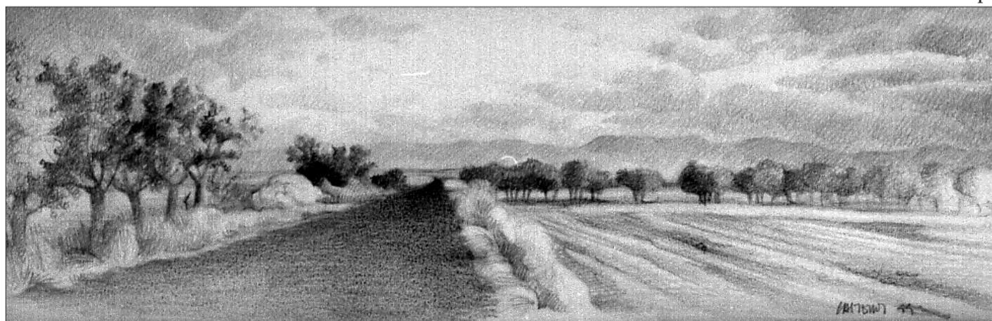
La llanada de Murillo. Lápiz grafito sobre papel. 33 x 11. 1999.