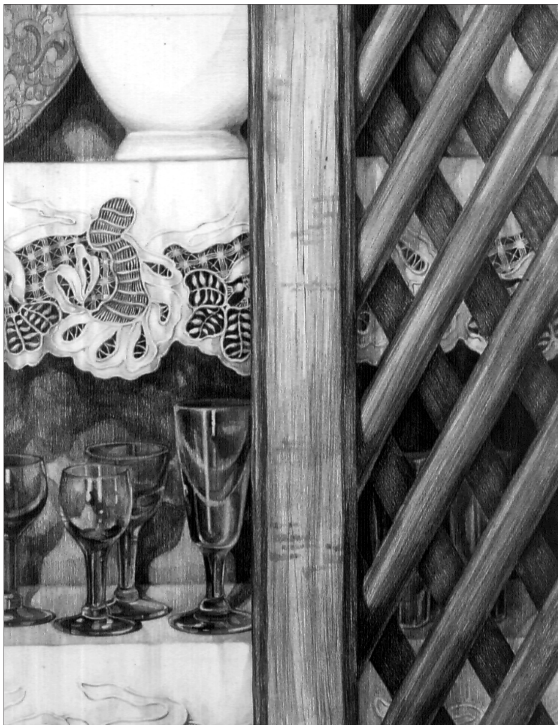
María. Lápiz grafito sobre papel. 35 x 45. 1988.