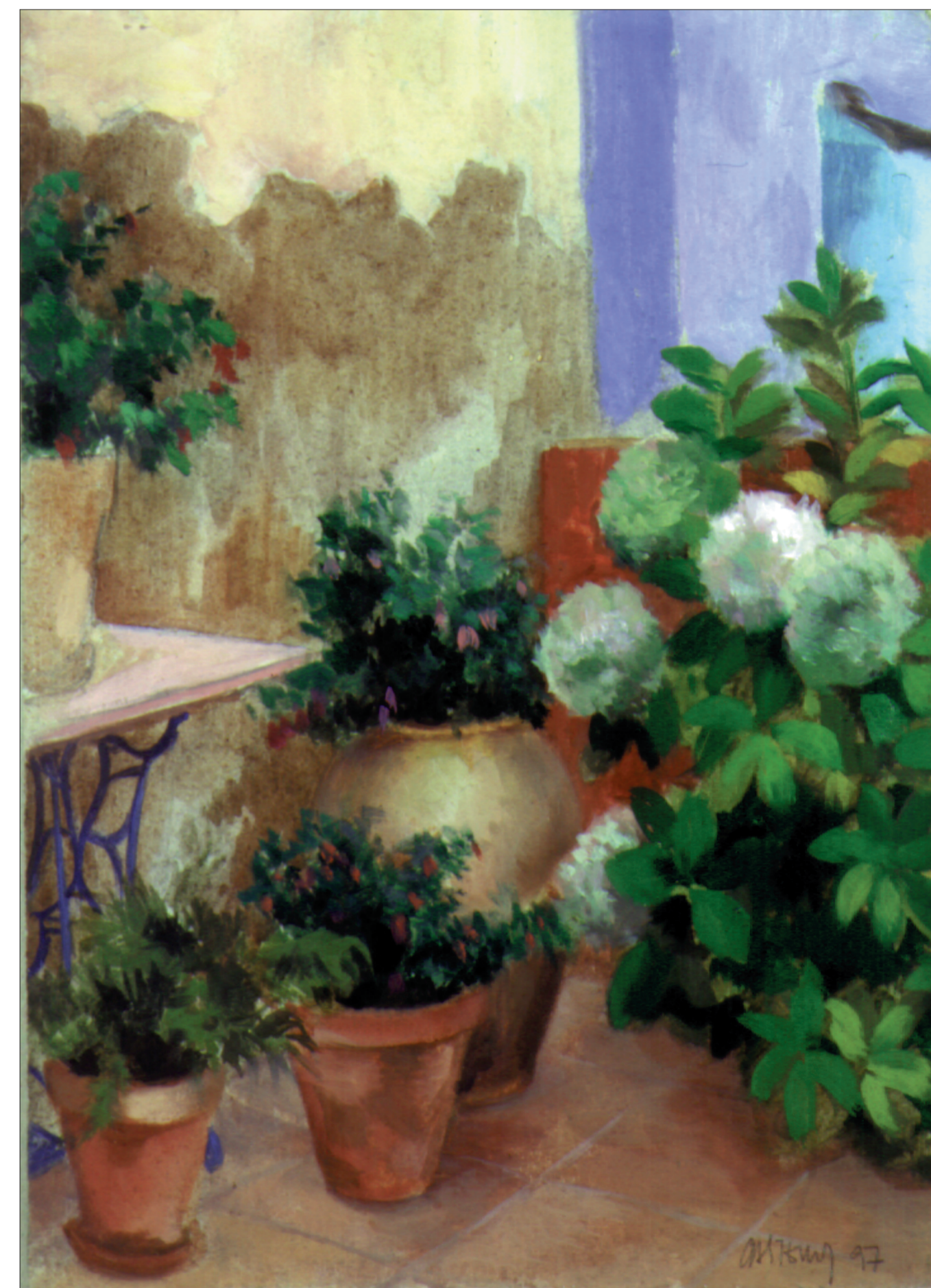
Rincón del patio (II). Óleo sobre cartón. 18 x 23. 1997.

Los dibujos firmados por Castellet tienen un mar de personalidad y demuestran que Rosa está a la sombra de sí misma, ella, una artista con la cabeza llena de planos pero sin poder olvidar las líneas sombreadas de una figura que traza el lápiz.