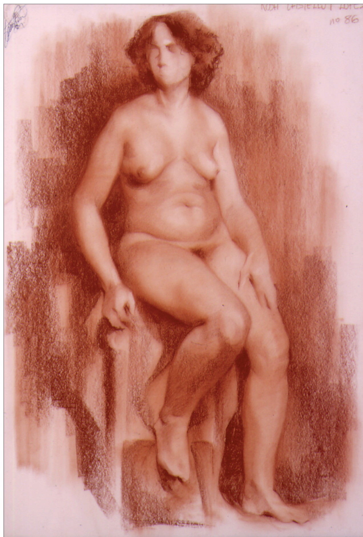
Desnudo. Sanguina sobre papel. 50 x 70. 1982.

Textos: Roberto Iglesias