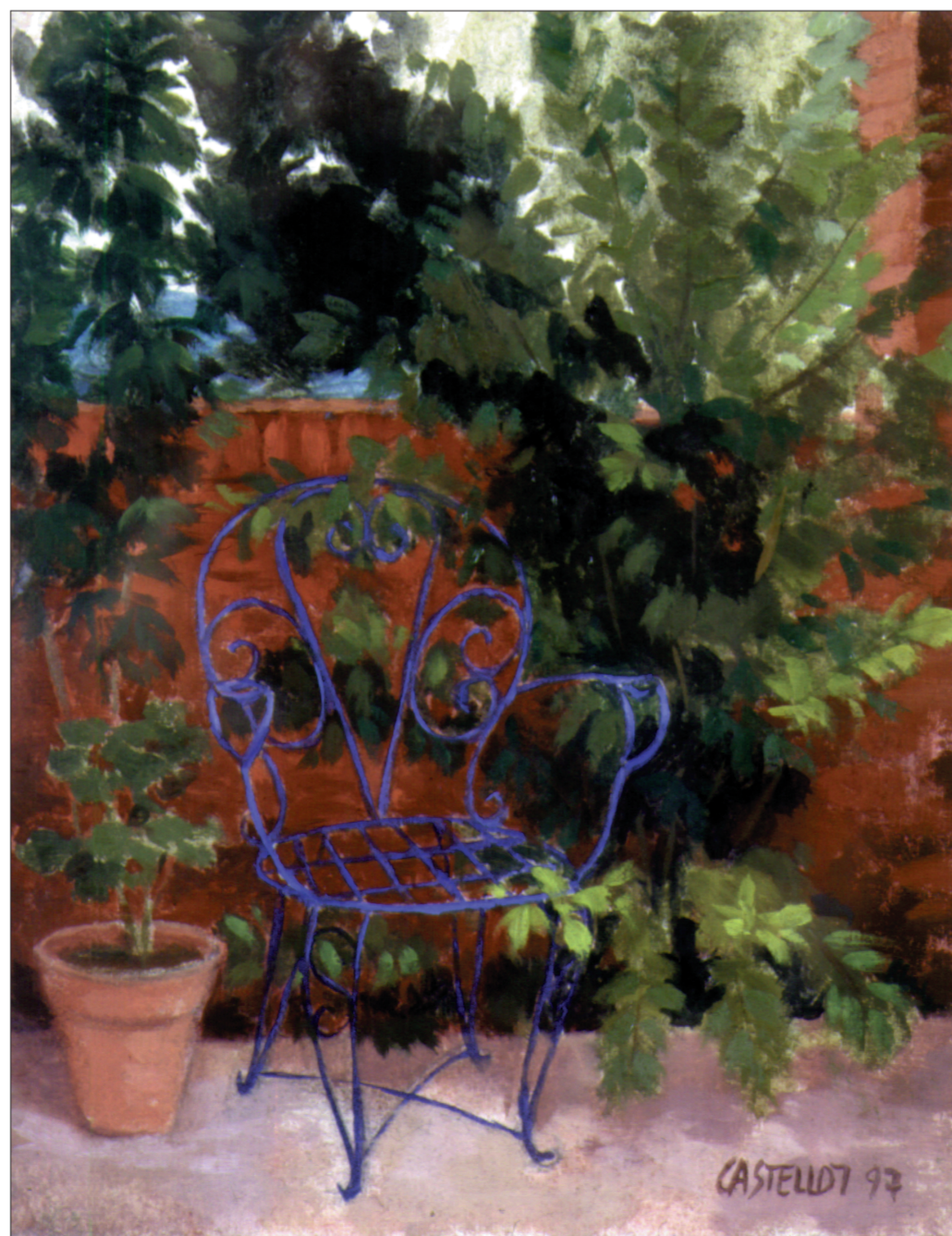
Rincón del patio. Óleo sobre cartón. 19 x 24. 1997.

Después de tantos años dibujando a carboncillo estatuas congeladas, prefiere el grafito agradecido.